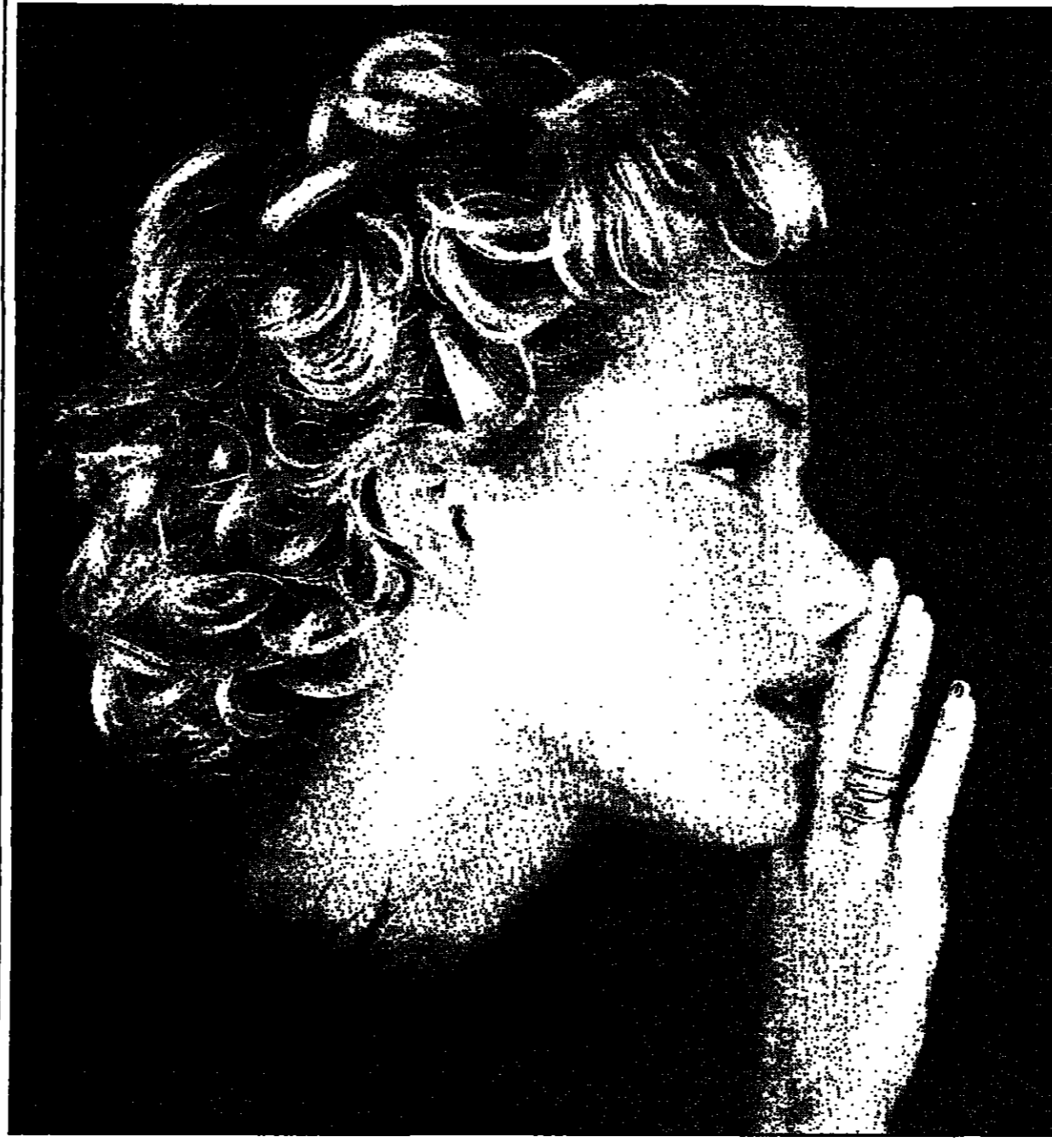
باريس - القدس العربي